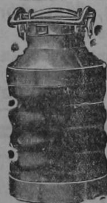
Almacenes al por mayor

Tanque alto y tanque bajo COCINAS PARA LEÑA Tres tamaños, a precios de ocasión